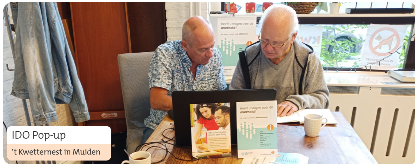
IDO Pop-up 't Kwetternest in Muiden