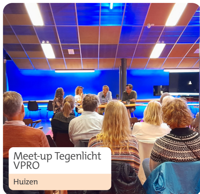
Meet-up Tegenlicht VPRO Huizen