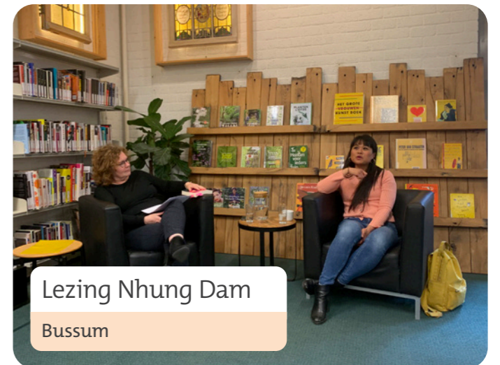
Lezing Nhung Dam Bussum