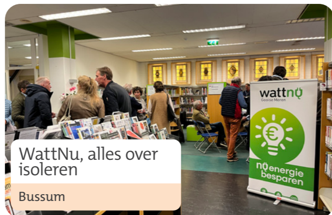
WattNu, alles over isoleren Bussum