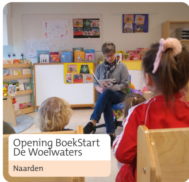
Opening BoekStart De Woelwaters

Wat is Boekstart in de kinderopvang? De bibliotheek ondersteunt met een aantrekkelijke voorleesplek in de kinderopvang, een collectie boeken, deskundigheidsbevordering voor pedagogisch medewerkers, betrekken van ouders en een voorleesplan waardoor (voor)lezen een vaste plaats krijgt op een locatie.