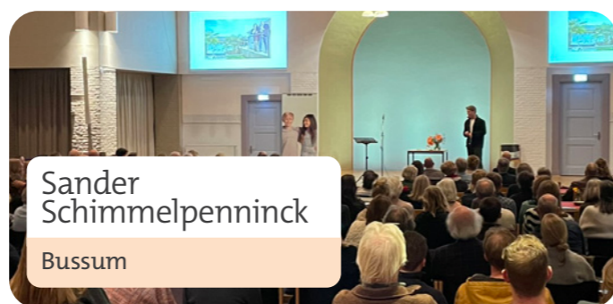
Sander Schimmelpenninck Bussum