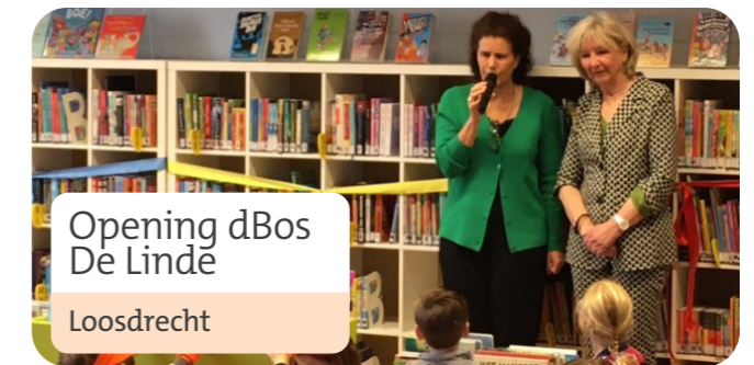
Opening dBos De Linde

In 2023 hebben we met 7 scholen een overeenkomst of een intentieverklaring getekend om een Bibliotheek op school te starten. We zijn volop bezig met de opstart. 27% van de scholen in ons werkgebied heeft een Bibliotheek op school.