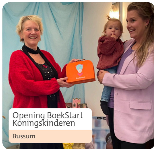
Opening BoekStart Koningskinderen