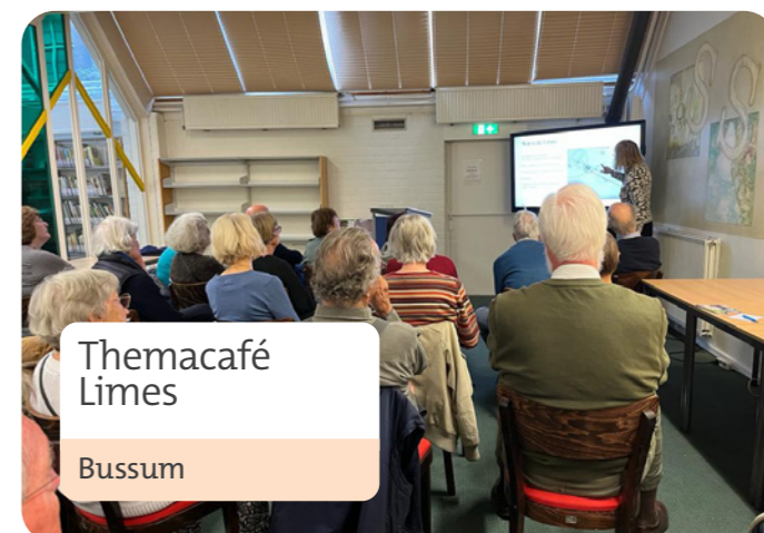
Themacafé Limes Bussum