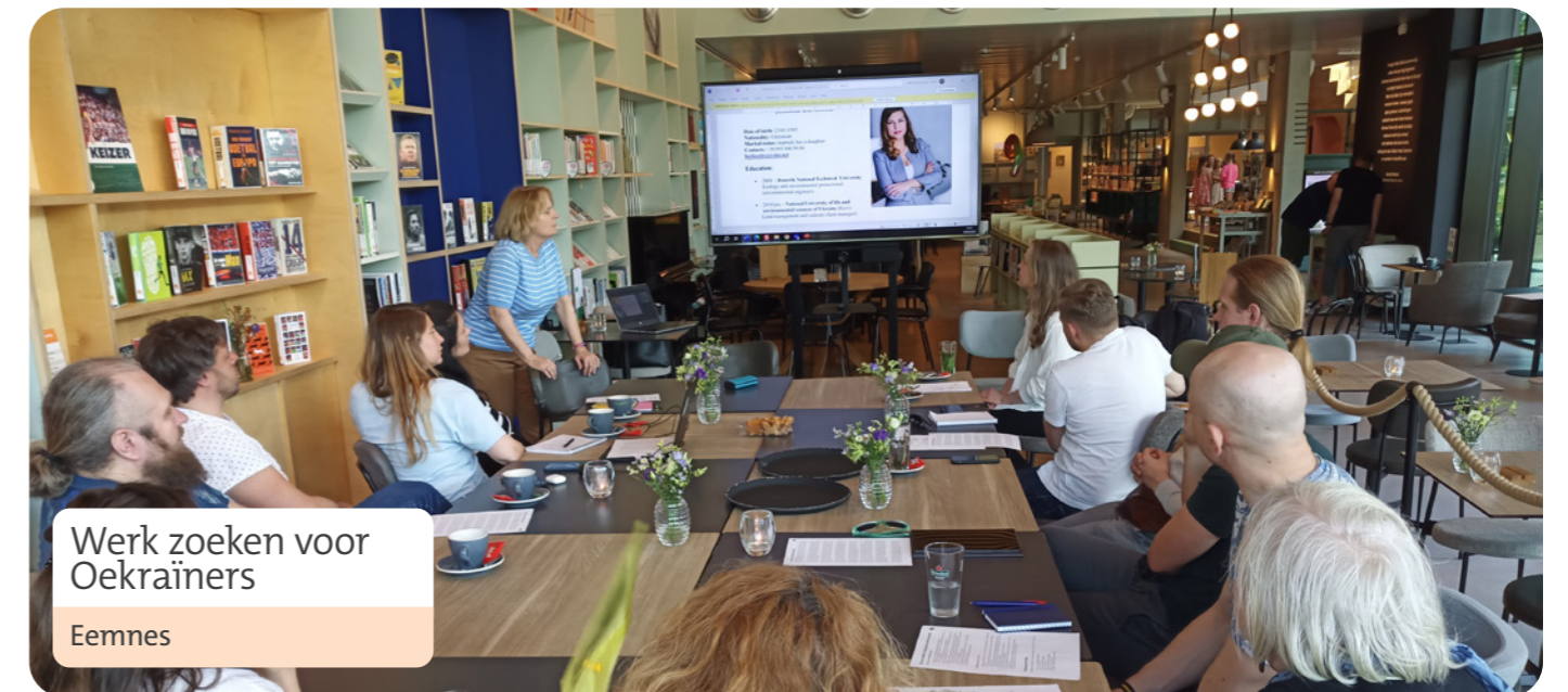
Werk zoeken voor Oekraïners Eemnes

NetWERK – werkzoeken voor Oekraïners - was afgelopen jaar in Eemnes, Huizen, Bussum en Naarden.