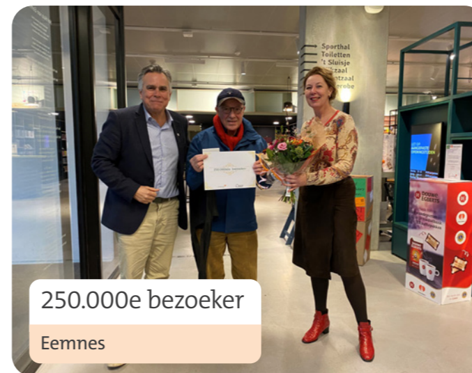
250.000e bezoeker Eemnes