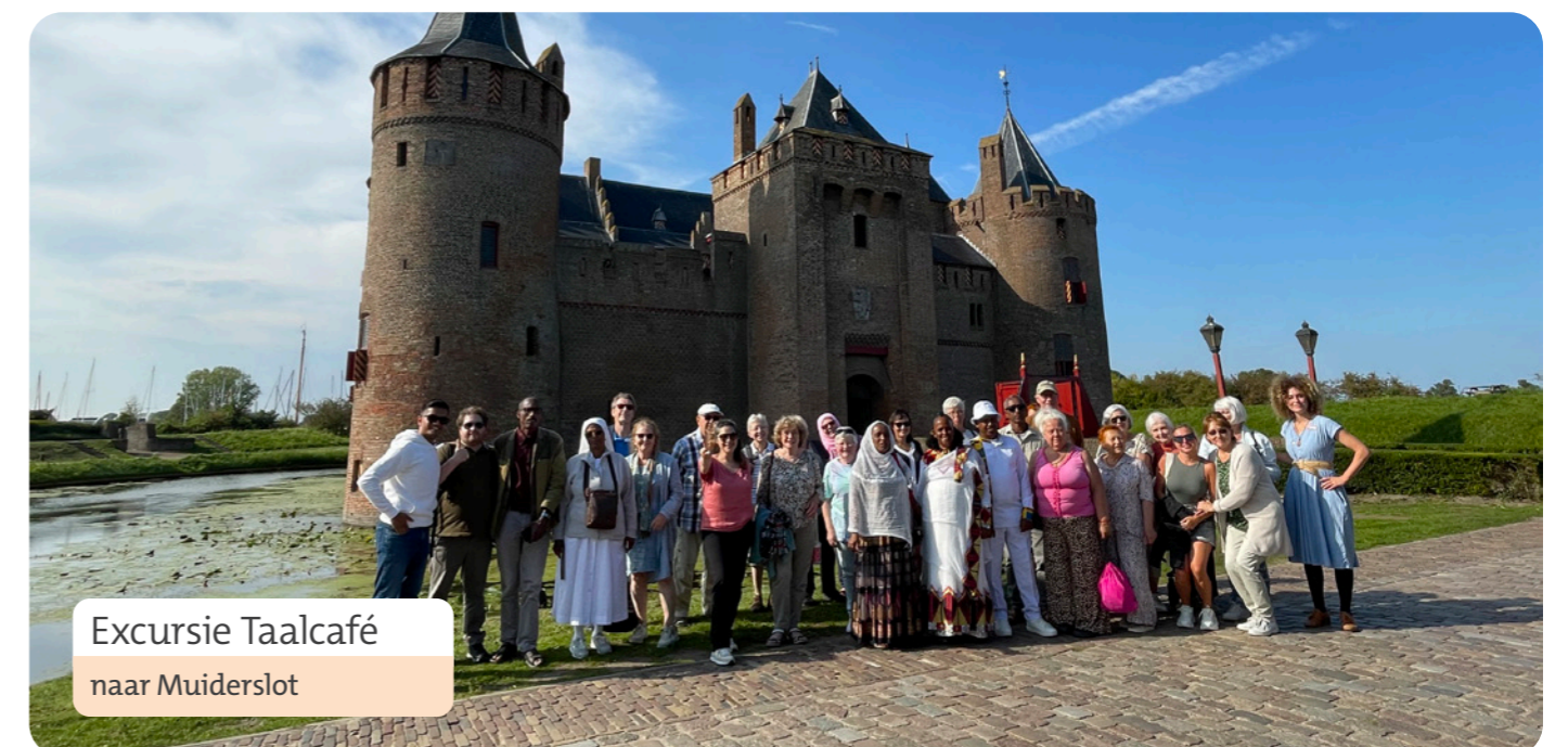
Excursie Taalcafé naar Muiderslot

NetWERK – werkzoeken voor Oekraïners - was afgelopen jaar in Eemnes, Huizen, Bussum en Naarden.