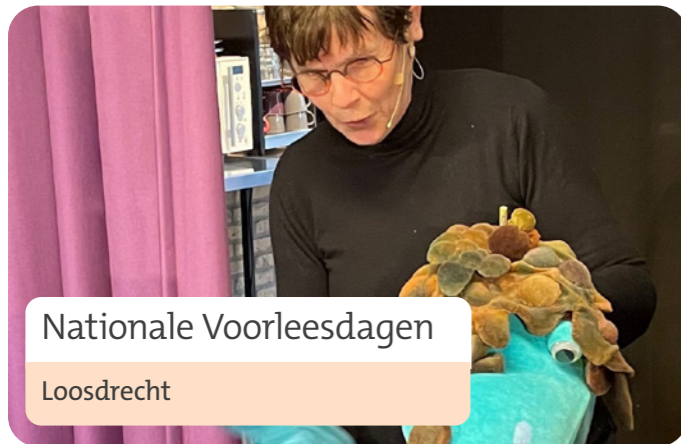
Nationale Voorleesdagen Loosdrecht