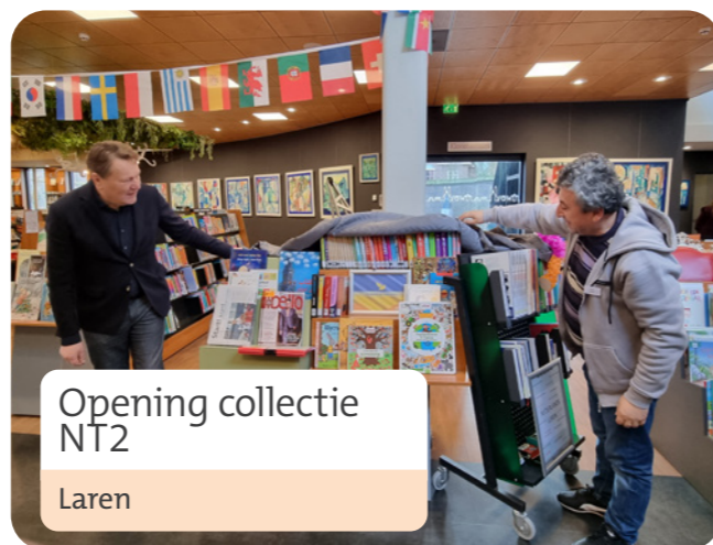
Opening collectie NT2