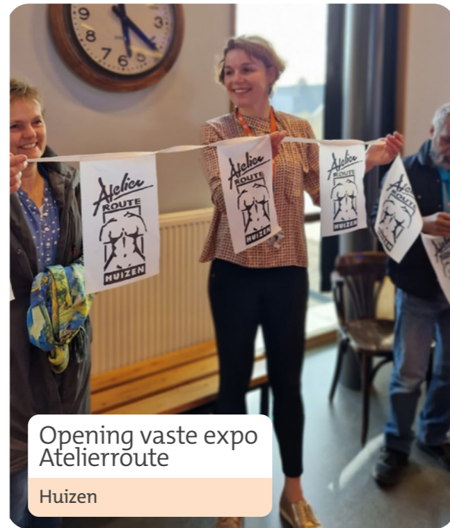
Opening vaste expo Atelierroute