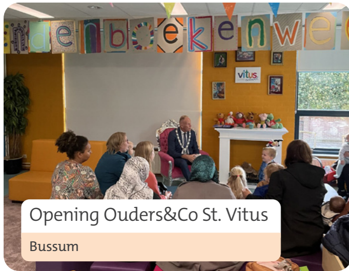
Opening Ouders&Co St. Vitus Bussum