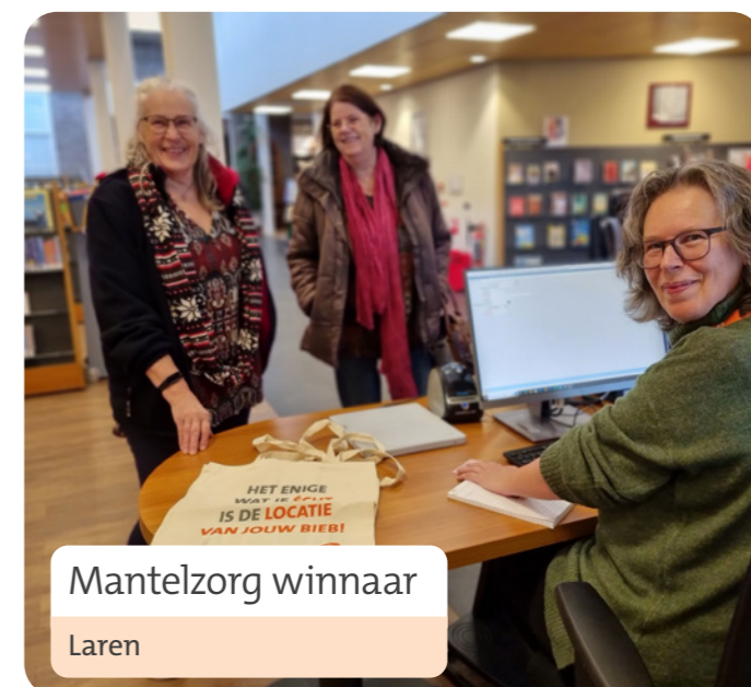
Mantelzorg winnaar Laren