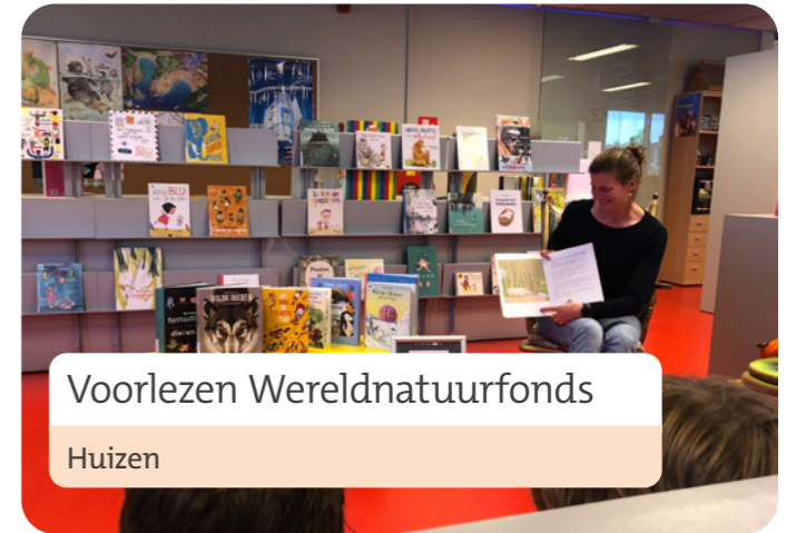
Voorlezen Wereldnatuurfonds Huizen